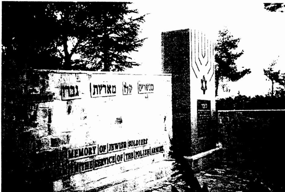
האנדרטה לזכר החיילים היהודים שנפלו במסגרת הצבא הפולני בבית העלמין הצבאי בהר הרצל