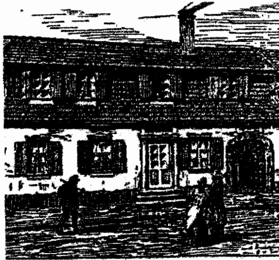
Ein letzter Bogen aus den Gründungsjahren. Das Häuschen — Urhaus der ersten Mansarden- häuser — ist jetzt als Möbel in den Stadt. Samm- lungen zu sehen und kann noch vor drei Jahren Kronenstr. 20.